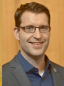
(Bürgermeister der Gemeinde Recke)